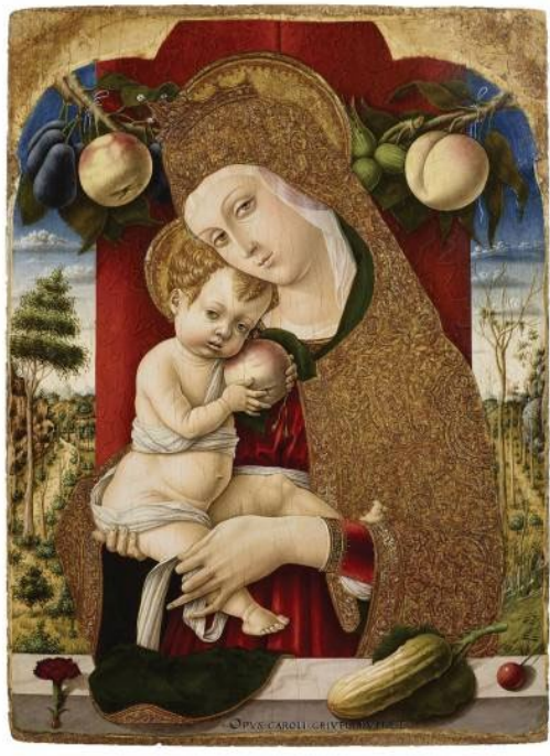
Paolo Crivelli Accademia Carrara Bergamo